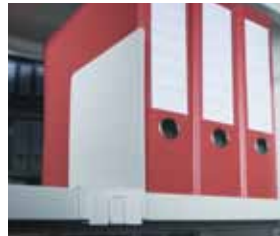
Buchstütze mit Klemme